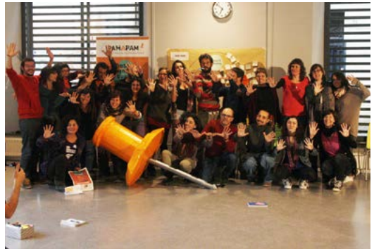
Pam a Pam

C. Bisbe Laguarda 4-6 / 93 441 53 35 mvega@setem.org, lmuixi@setem.org www.setem.cat , www.pamapam.org